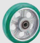
耐摩耗緑ゴム (アルミホイル,B入) (AW(AR)Gr)