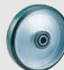
ウレタン (鋼板ホイル,B入,インジェクション) (UWF/INJ)