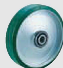
ウレタン (鋼板ホイル,B入) (UWF)