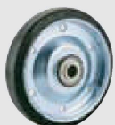
耐摩耗ゴム (鋼板ホイル,B入) (WF(AR))