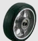
ゴム (アルミホイル,B入) (AW)