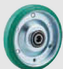
緑ゴム (鋼板ホイル,B入) (WF(Gr))