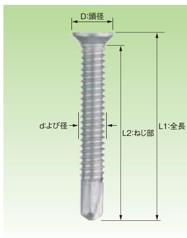
■ステンレスSUS410 サラ D=6 細目 マシンねじタイプ パシペート