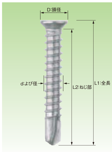
■三価ユニクロ サラ D=6 粗目