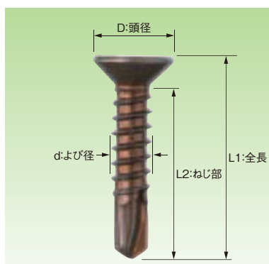
■ステンレスSUS410 サラ ブロンズ