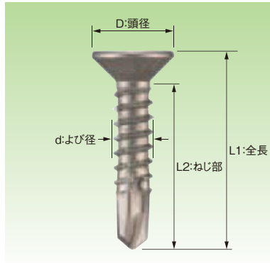
■ステンレスSUS410 サラ パシペート