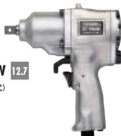
No. GT-P80W 12.7