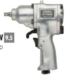
No. GT-P65W 9.5