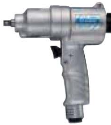
No. GT-P60XW 9.5

取付 (ピンロック式) 消音装置付/後方排気 付属品 回転部作動油 VG-10 衝撃部作動油 VG-32