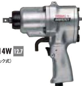
No. GT-P14W 12.7