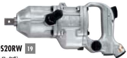
No. GT-S20RW 19