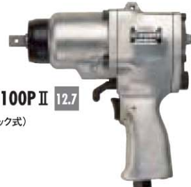
No. GT-W100P II 12.7