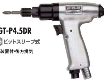
No. GT-P4.5DR 6.35 ビットスリーブ式 消音装置付/後方排気