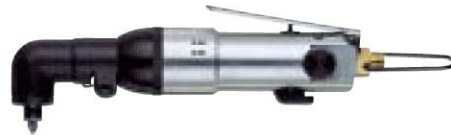
No. GT-PLRC 6.35 ビット止ボール式