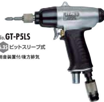
No. GT-P5LS 6.35 ビットスリーブ式 消音装置付/後方排気