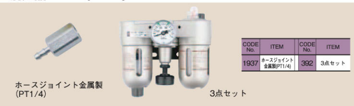
ホースジョイント金属製 (PT1/4)