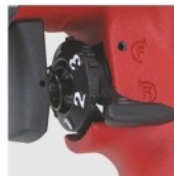
出力調整ダイヤル