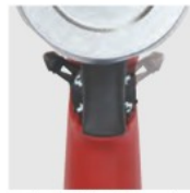
回転方向切替レバー