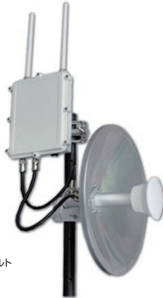
製品使用例 屋外用WiFiアクセスポイント