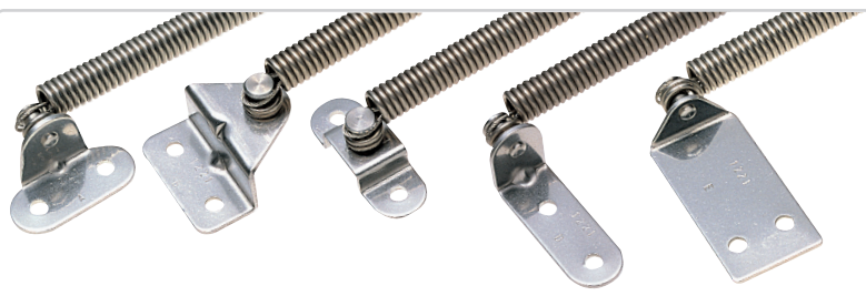
B-1221-A B-1221-B B-1221-C B-1221-D B-1221-E

สามารถประกอบขาของที่เป็นตัวเลือกได้โดยอิสระ กรุณาติดต่อสอบถาม Can be combined with any optional bracket.