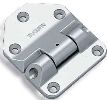
B-858-2S (สำหรับด้านข้าง) (For side gate)