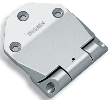
B-858-2R (สำหรับด้านหลัง) (For rear gate)