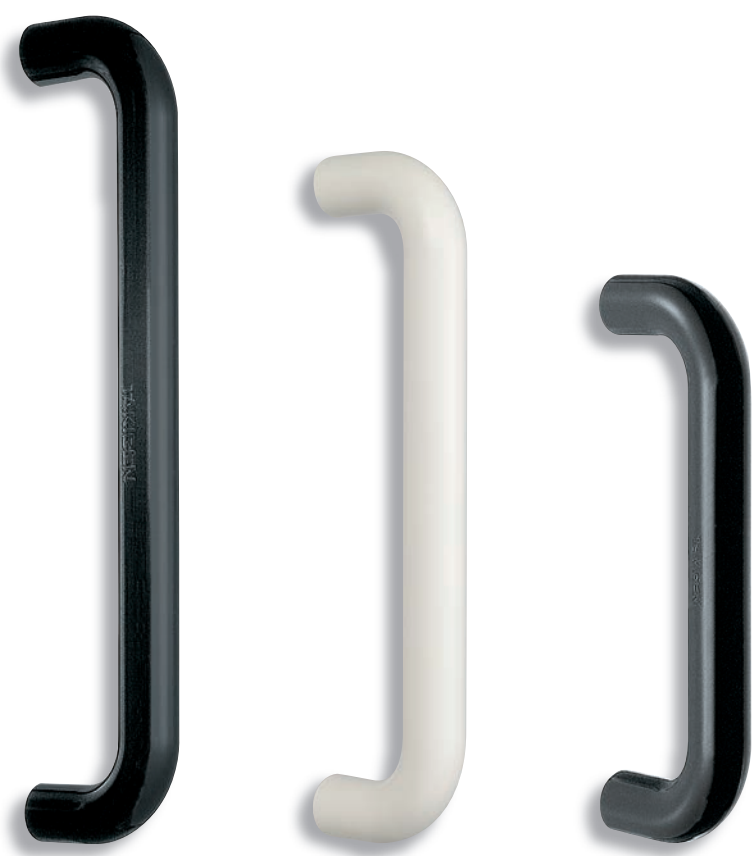
AP-42-C-1-Black ดำ AP-42-C-2-Ivory สีงาช้าง AP-42-C-3-Black ดำ