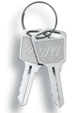
กุญแจ No.0200 Key