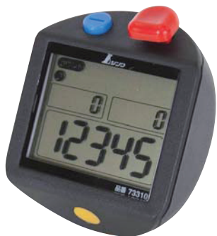
73310 デジタル数取器 手持型