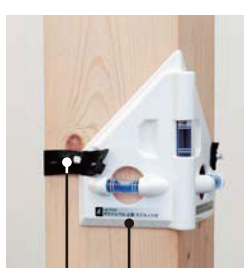
目盛付 柱取り付け用ゴムバンド付