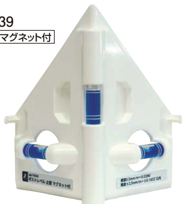
76339 止型 マグネット付