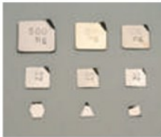
基準分銅型板状分銅

材質 非磁性ステンレス鋼 磁化率 JIS B 7609: 2008 10項 のF1級に適合 表面粗さ F1, F2……2μm以下 M1……5μm以下 密度 JIS B 7609: 2008 11項 に適合