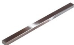
平行キー材 旧JIS S45C