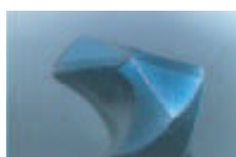
広い溝ポケット Wide flute width

◎:最適 Excellent ○:適用 Good ×:不適 Not Used 無印 (No mark):推奨しません Not recommended