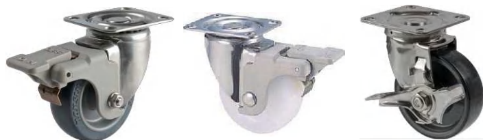
SU-STC-75 TP S-12

▶▶ SU-STC 自在 S-12・S-2ストッパー 65-200mm/S-12、S-2ストッパーは車輪の回転を止めるストッパーです。