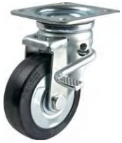
STM-100 VS W-3

▶▶ STM 自在 W-3ストッパー 75-200mm / W-3ストッパーは車輪の回転と旋回を同時に止めるストッパーです。