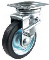
STM-130 VS W-3