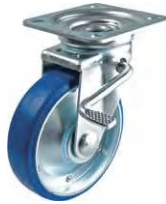
STM-150 VU W-3