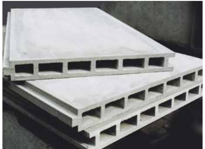
▲押し出し成型セメント