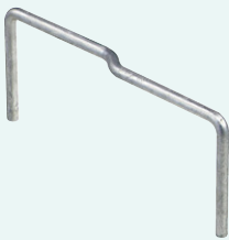
溶融亜鉛スズ合金めっき