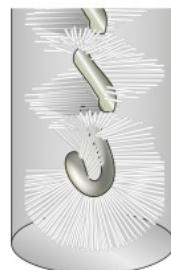
スパイラルホールブラシ U型 Spiral Hole Brushes End-Rounded

通常のスパイラルホールブラシに比べ 突き当り面のダメージが少ないです。 Less damage to the end surface than regular spiral hole brushes.