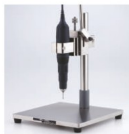
使用例 Example of use

With a Rotary Handpiece installed, the drill stand is used for boring, grinding and other similar purposes. Can be used in combination with all listed handpieces except RECIPRON and Mini Belt Sander. The handpiece can be set both in vertical and horizontal positions.