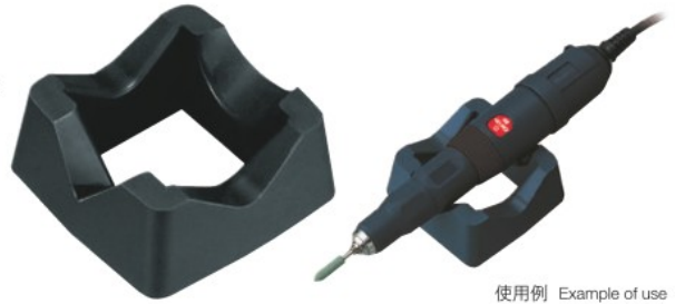
使用例 Example of use

■外形寸法 Outside dimensions: 72 (W) × 72 (D) × 30 (H) mm