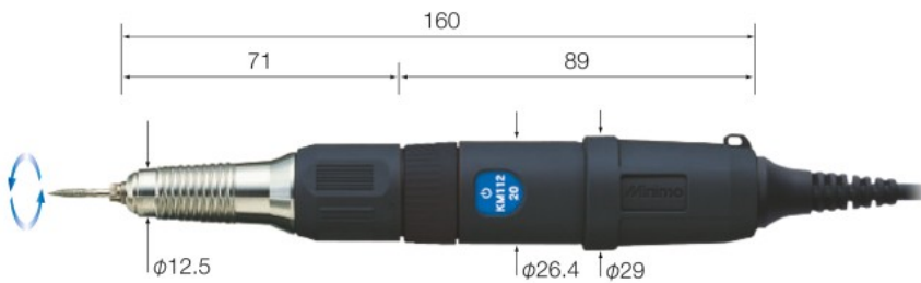
搭載ヘッド: H021 Head Model