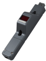
ME8109 15Aコンセントバー用電流監視装置 F形 ※負荷がOFF状態で「-00.1」、「00.1」等の表示が繰り返し表示される場合があります。機能上問題ありません。