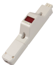
ME8110 20Aコンセントバー用電流監視装置 F形 ※負荷がOFF状態で「-00.1」、「00.1」等の表示が繰り返し表示される場合があります。機能上問題ありません。