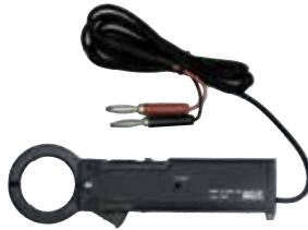
▲別売品:直流クランプアダプタ (型式:LAD-240)