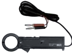
▲別売品:直流クランプアダプタ (型式:LAD-240)