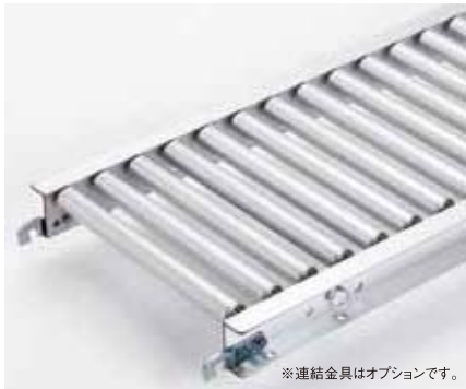
※連結金具はオプションです。