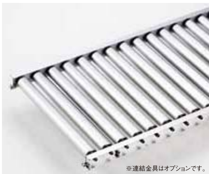
※連結金具はオプションです。