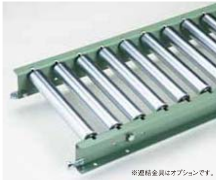
※連結金具はオプションです。