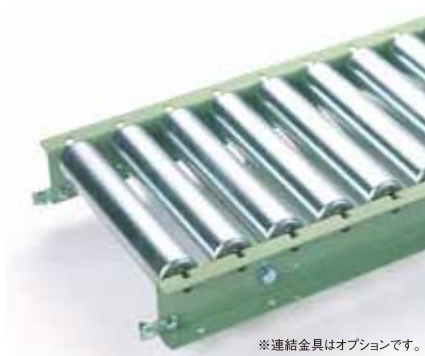
※連結金具はオプションです。