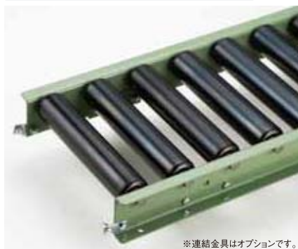
※連結金具はオプションです。