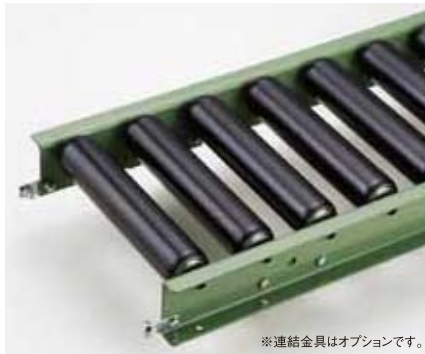
※連結金具はオプションです。