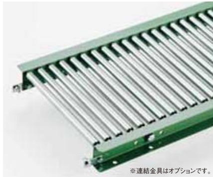
※連結金具はオプションです。