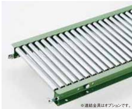
※連結金具はオプションです。