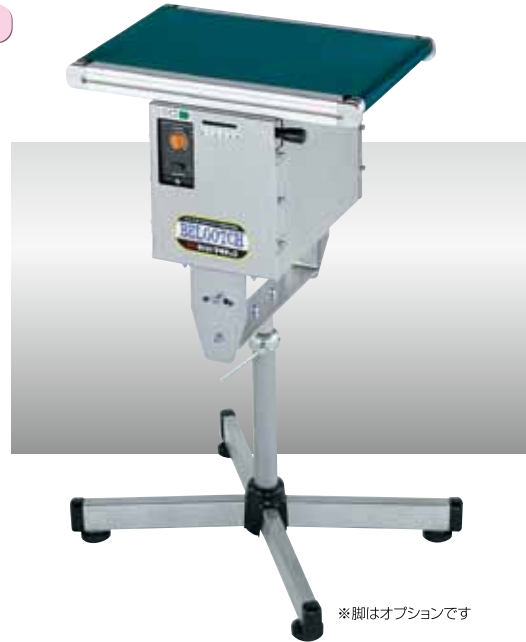
※脚はオプションです

ジョイントモデル、TYPE Jの蛇行抑制型です。保守点検の難しい場所への設置や、正逆運転等、ハードな使用条件にも対応します。