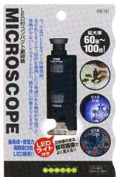
プリスターパック H180XW112mm