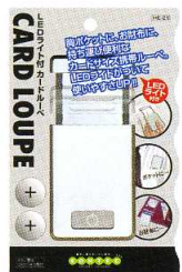
プリスターパック H180XW112mm