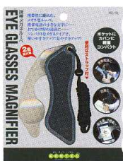
プリスターパック H180XW136mm