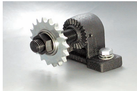
ST-S + ID + SPB