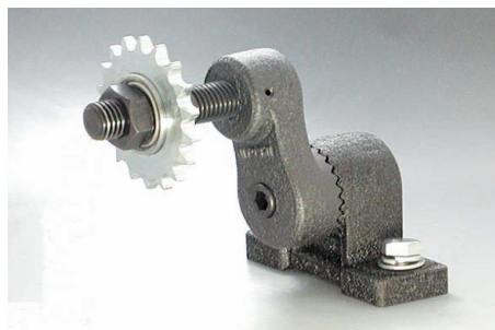
ST-R + ID + SPB