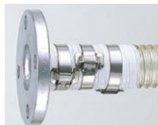
谷埋め・フープバンド締め (JISフランジ付き)