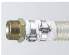
谷埋め・フープバンド締め (M1金具付き)