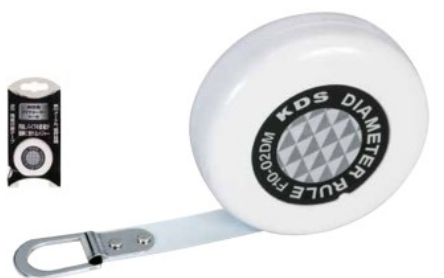
アクリル樹脂コート