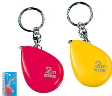
アクリル樹脂コート