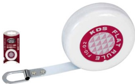
アクリル樹脂コート