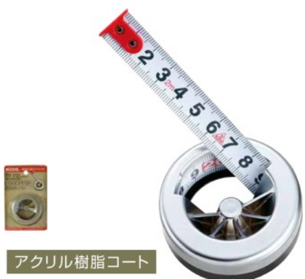
アクリル樹脂コート