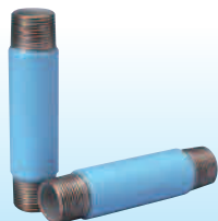
外面一層ポリエチレン被覆 水道用ポリエチレン粉体ライニング鋼管製 PDパイプニップル 〔略号：PD-PNI〕