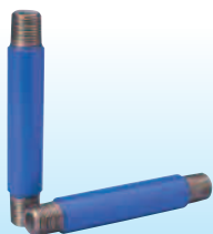
水道用内外面硬質塩化ビニルライニング鋼管製 VDパイプニップル 〔略号：VD-PNI〕