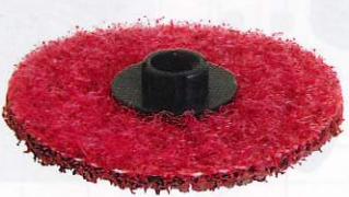
●スカットディスクの場合