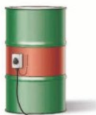
ドラム缶保温用 缶用ラバーヒーター(EA896HC-1)使用例

屋外に設置している金属管の加熱、ドラム缶の保温、寒冷地における建機の油圧シリンダー保温などに使用されます。下記はその一例で、シリコンラバーの柔軟性を活かした熱源として様々な業界で使用されています。