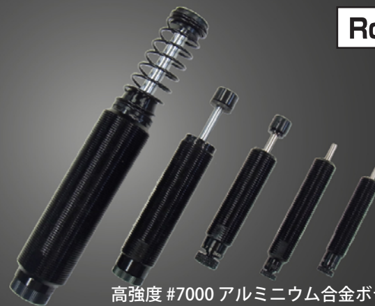
高強度 #7000 アルミニウム合金ボディ採用 ※ ECO シリーズのみ