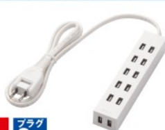
ほこり防止シャッター付きスリムタップ