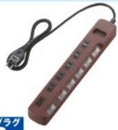
シャッタータップ[flecc barra]